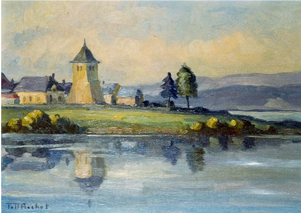
Tour et église dans une symphonie de bleus et de verts.