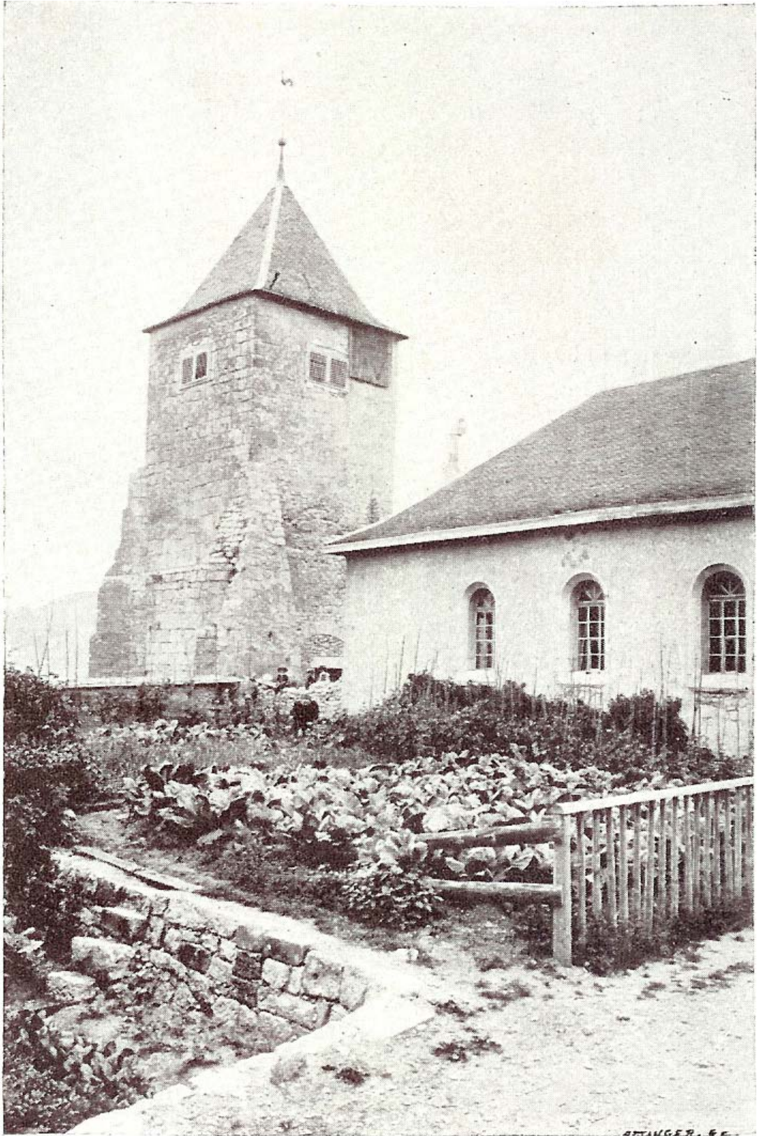
L'église de l'Abbaye.